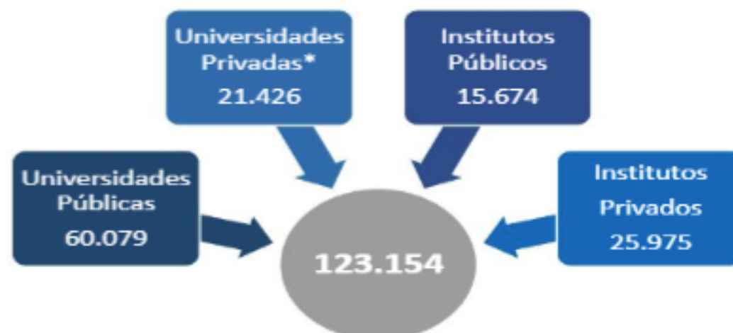
Figura 4 Número de Estudiantes (Segundo Semestre 2017)

La ciudadanía destaca que para lograr los objetivos de incrementar la productividad, agregar valor, innovar y ser más competitivo, se requiere investigación e innovación para la producción, transferencia tecnológica; vinculación del sector educativo y académico con los procesos de desarrollo; pertinencia productiva y laboral de la oferta académica, junto con la profesionalización de la población; mecanismos de protección de propiedad intelectual y de la inversión en mecanización, industrialización e infraestructura productiva. Estas acciones van de la mano con la reactivación de la industria nacional y de un potencial marco de alianzas público-privadas. (PND, 2017)