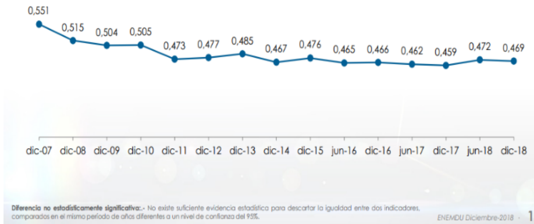
Figura 3 Coeficiente de Gini

La desigualdad se establece por la distribución del ingreso por persona, y para medirlo se utiliza el Coeficiente de Gini, este se encuentra en rango de 0 (perfecta igualdad) a 1 (perfecta desigualdad). La figura 3 muestra el coeficiente de Gini a nivel nacional, es así como se muestra que para diciembre del 2018 el índice era de 0.469.