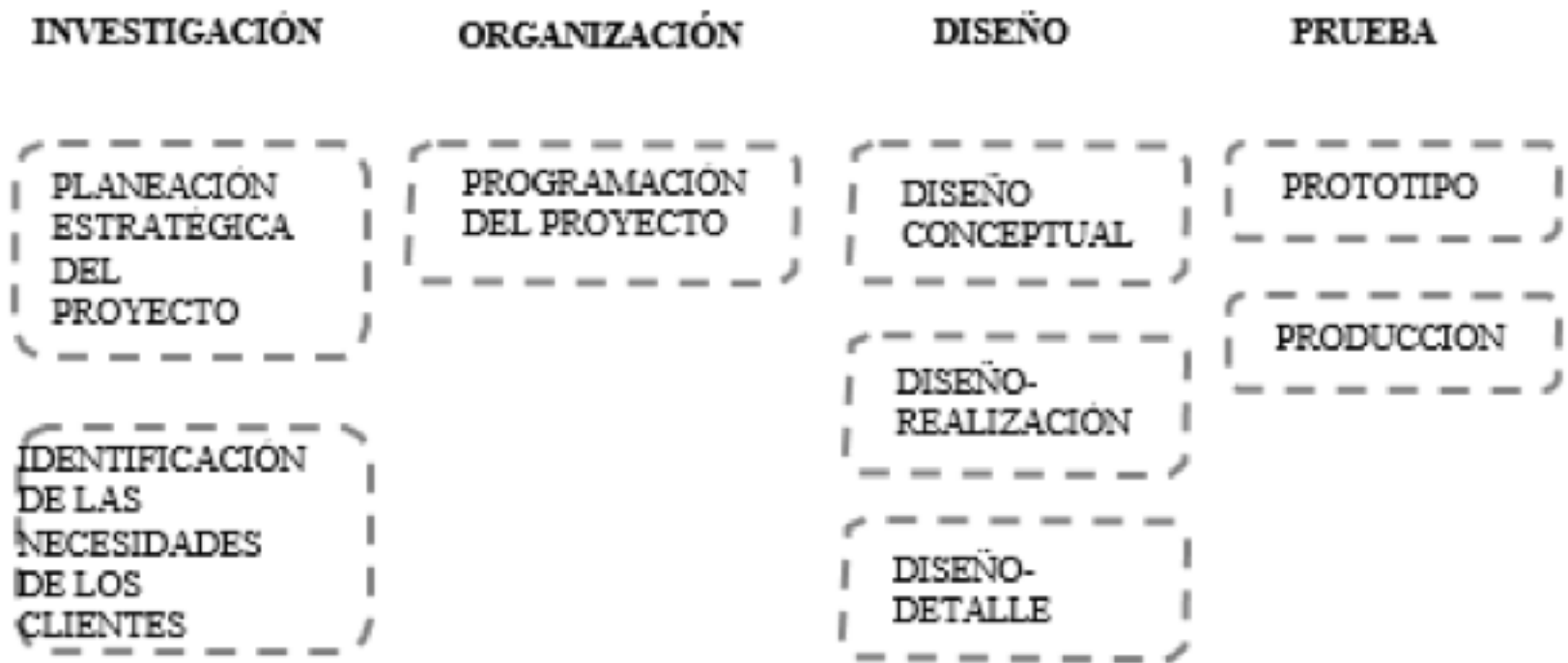
Figura 1 Proceso estándar de diseño

En el presente estudio de revisión se ha determinado un proceso básico y general para cualquier modelo y para cualquier metodología de diseño en las etapas presentadas en la figura 1.