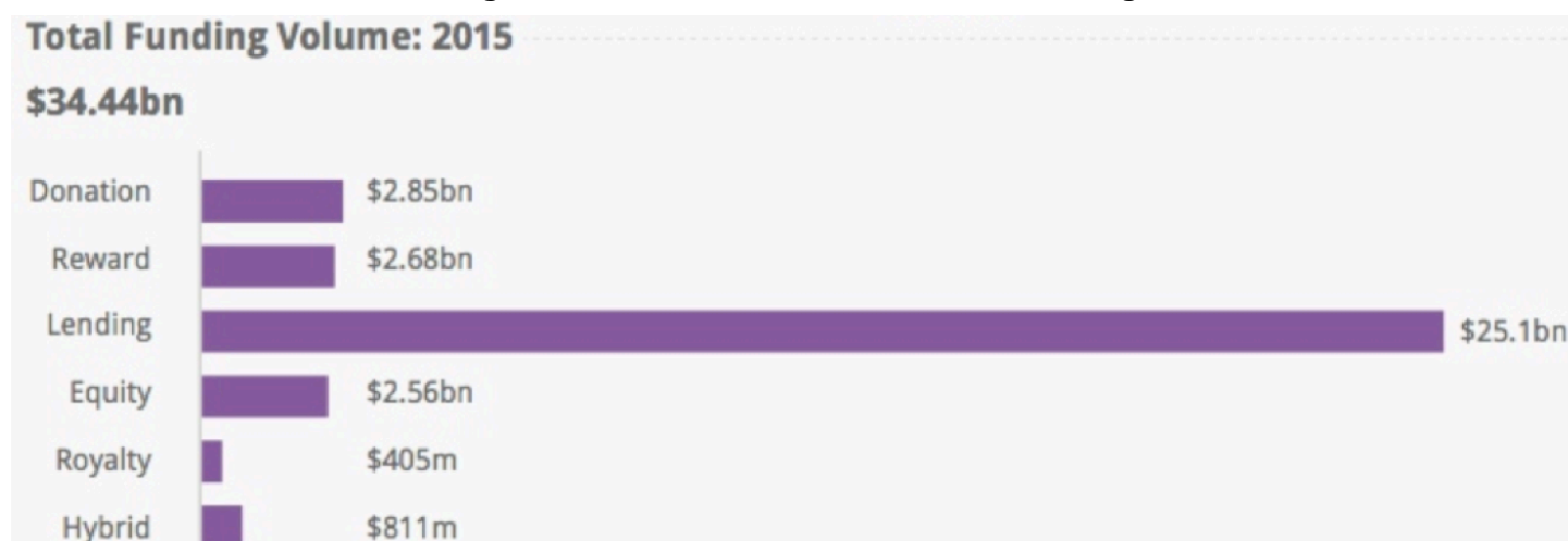
Figura N.º 3 Estadísticas del Crowdfunding

Colombia debe facilitar financiamiento rápido y de bajo costo a la pyme, para todas las modalidades que ofrece el Crowdfunding, se debe avanzar rápidamente ya que solo se tiene la modalidad de donación y recompensa, se requiere se desarrolle del Crowdfunding financiero, modalidades de préstamo P2P o la de Inversión con participación accionaria, gran importancia merece la modalidad P2P (Préstamo persona a persona) el cual es el de mayor crecimiento en el mundo, la modalidad exija el pago de un interés y funciona por fuera del sistema bancario, Observar la Figura N.º 3 Estadísticas del Crowdfunding.