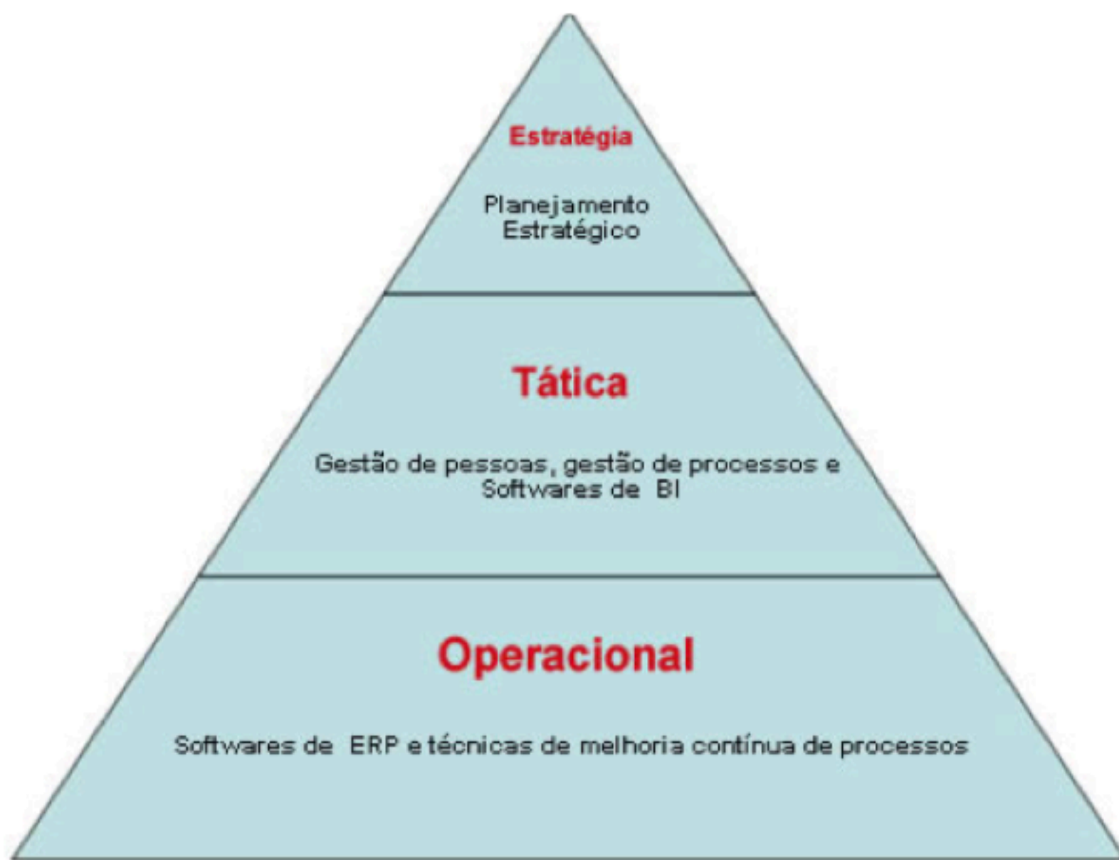
Figura 2: Planejamento estratégico, tático e operacional.

Esses níveis que estão relacionados diretamente aos planejamentos são demonstrados na figura 2, a seguir.