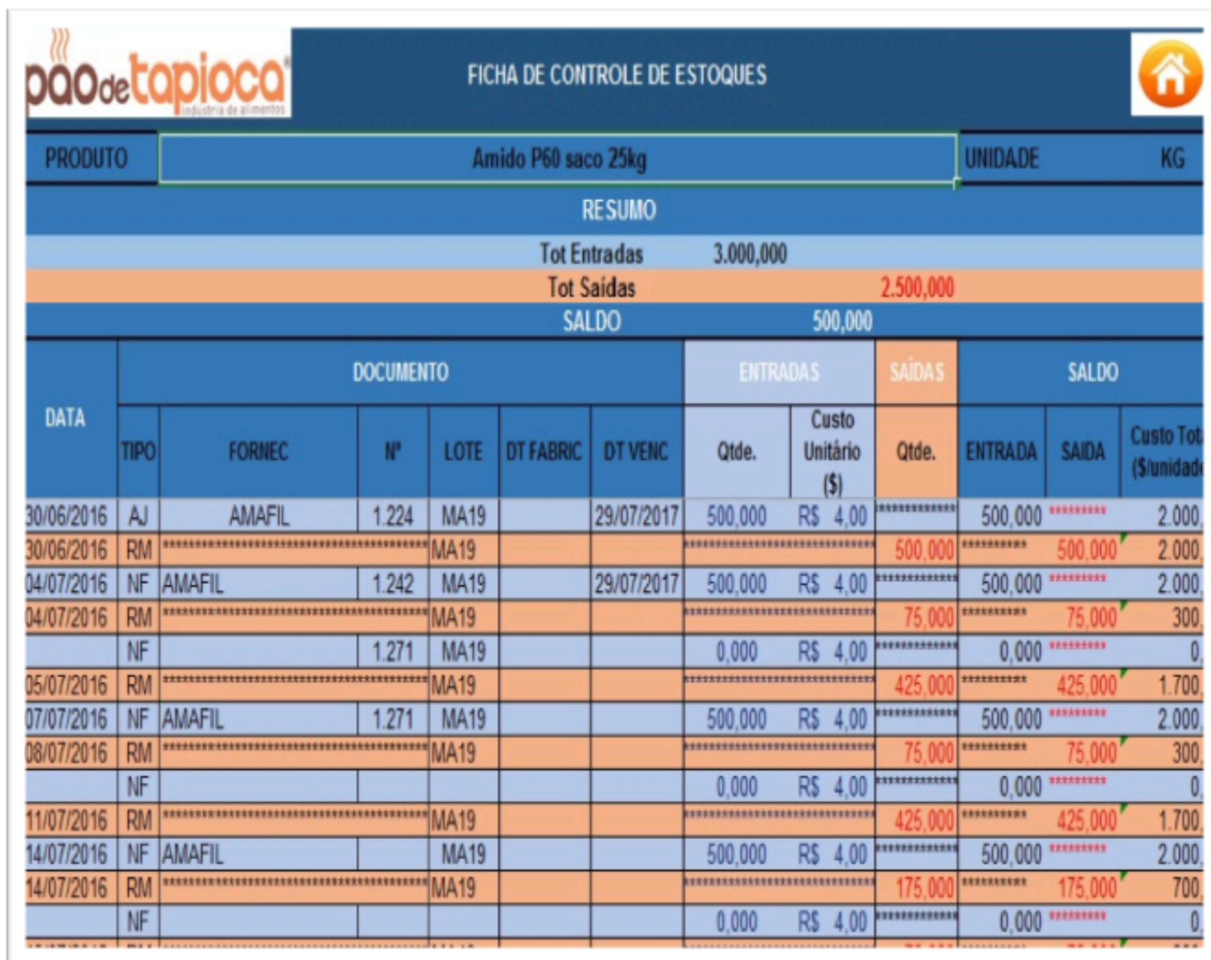
Figura 7: Ficha de controle individual II.

Todos os itens foram separados e agrupados de acordo com sua relevância, isto é, na planilha de Matéria Prima, apresentada na figura 6, constam todos os ingredientes usados na Pão de Tapioca, quer sejam para produção ou testes de novos produtos, tendo cada item uma ficha de controle individual, demonstrada na figura 7, a seguir.