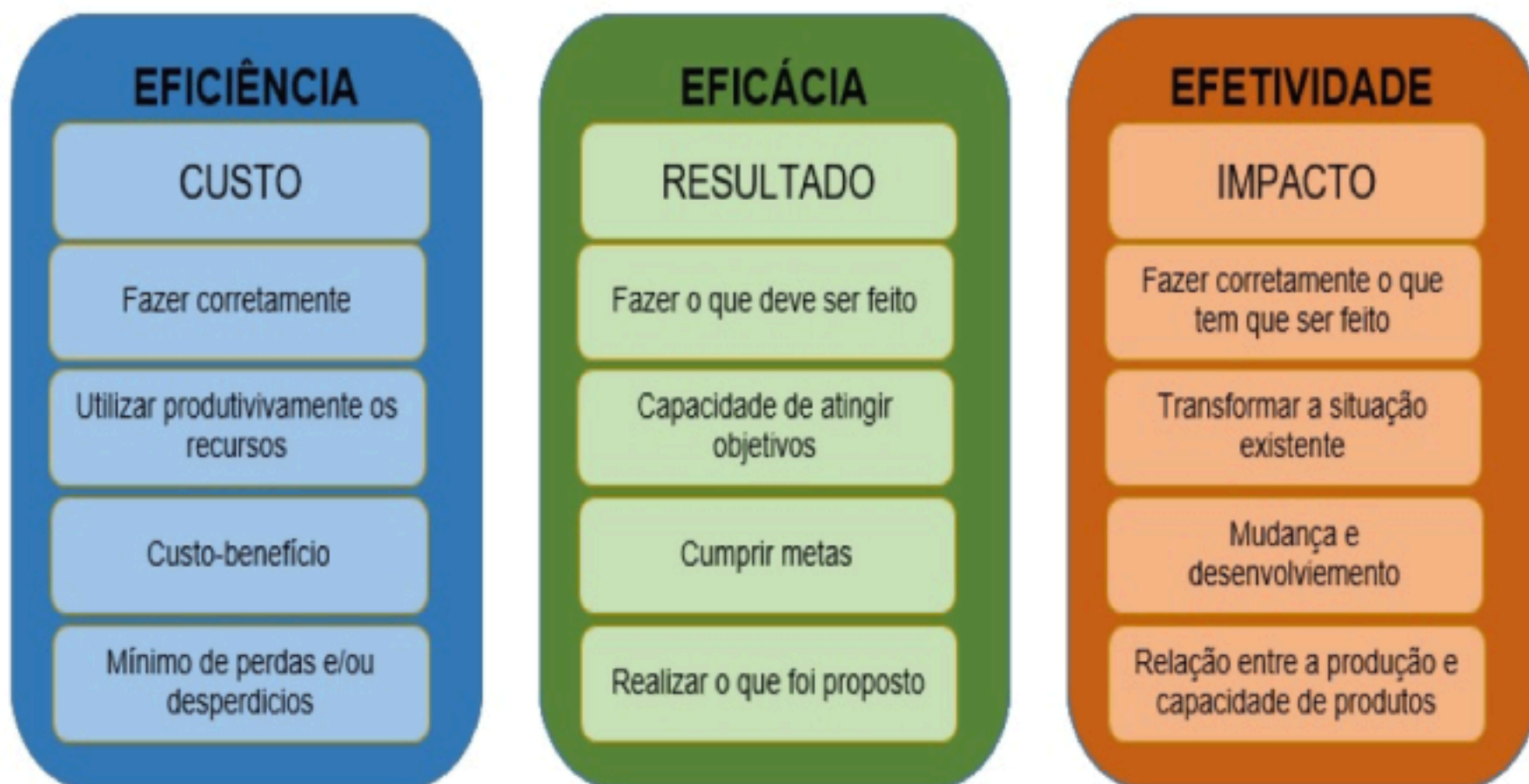
Figura 1: Diferenças: eficiência x eficácia x efetividade.

O P.P.C.P. tem como objetivos, no século XXI, garantir a eficiência, a eficácia e a resposta rápida às mudanças do mercado. Pode-se observar algumas diferenças e características desses pontos na figura 1, a seguir.